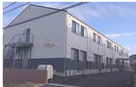
ご長寿くらぶ 土浦みぎもみⅡ