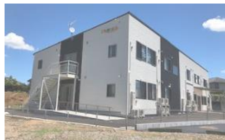
ご長寿くらぶ つくばみらい小絹