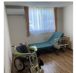
ご長寿くらぶ 南守谷